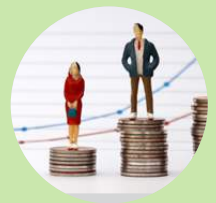
פערי שכר בין גברים לנשים - האם השינוי מעבר לפינה?