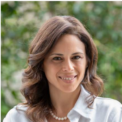
זהבית צדקיהו, הון פרמיום - ביטוח, פנסיוני ופיננסים