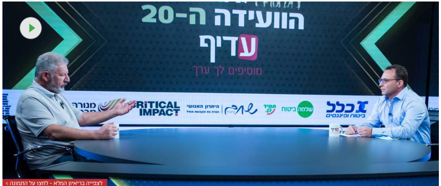
לצפייה בריאיון המלא - לחצו על התמונה >

הבעלים והמנכ"ל המשותף של אלטשולר שחם, בתחזית לשנת 2021 | "ברגע שהציפייה תהיה שהריבית תתחיל לעלות, זה יכול להיות הסוף של השווקים, מפני שמה שתרם לשווקים שיעלו זו הריבית האפסית. זה יכול להתהפך"