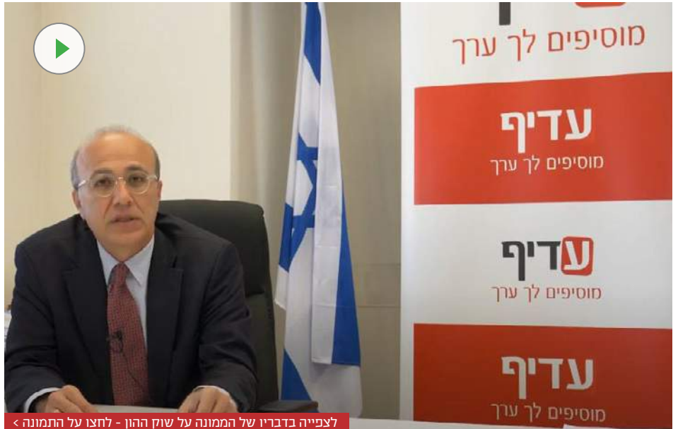
לצפייה בדבריו של הממונה על שוק ההון - לחצו על התמונה >

"רפורמה שנייה הינה רפורמת 'דמי הניהול המשתנים' שנועדה לאפשר מסלולי השקעה בעלי מנגנון תגמול המגדיל את הזיקה בין מנהל ההשקעות לבין החוסך, במטרה להגדיל את התשואה נטו לחוסך תוך בקרת התמריצים על נטילת הסיכון. כמובן שמסלולים אלו יתאפשרו לצד מסלולים בעלי דמי ניהול קבועים".