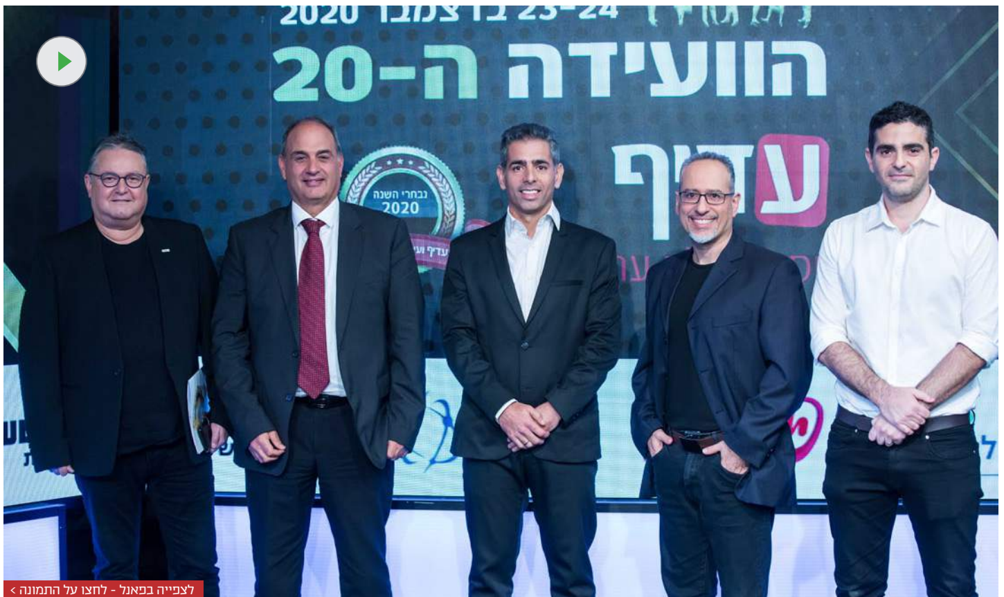
לצפייה בפנל - לחצו על התמונה <

יו"ר קואליטי אמר כי התהליך שעוברים הסוכנים הוא אבולוציה בענף צעיר יחסית | אייזיק: השיווק הישיר הוא מפלצת שהולכת וגדלה | אומיד: כועס על סוכנים שלא לקחו החלטה בעניין חברות שמשווקות מולם