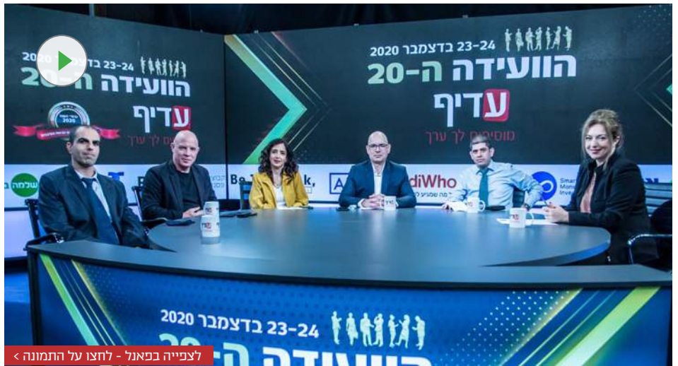
לצפייה בפאנל - לחצו על התמונה <

"אבל אני רוצה לחזור למציאות ואנחנו לא חיים בעולם אוטופי, אם היית בעלים של חברה והיית צריכה לקבל דילמה האם לקבל כסום כסף מסוים, חלקו אולי מכוסה על ידי הביטוח, ובסכום הזה להציל את החברה שלך או לדבוק בעקרונות שלא משלמים, עמדתי ברורה. אני מציל חברות, זה התפקיד שלי למקסם את הערך. "בעניין הזה אני רוצה לתקן מיתוסים קיימים, אם כבר