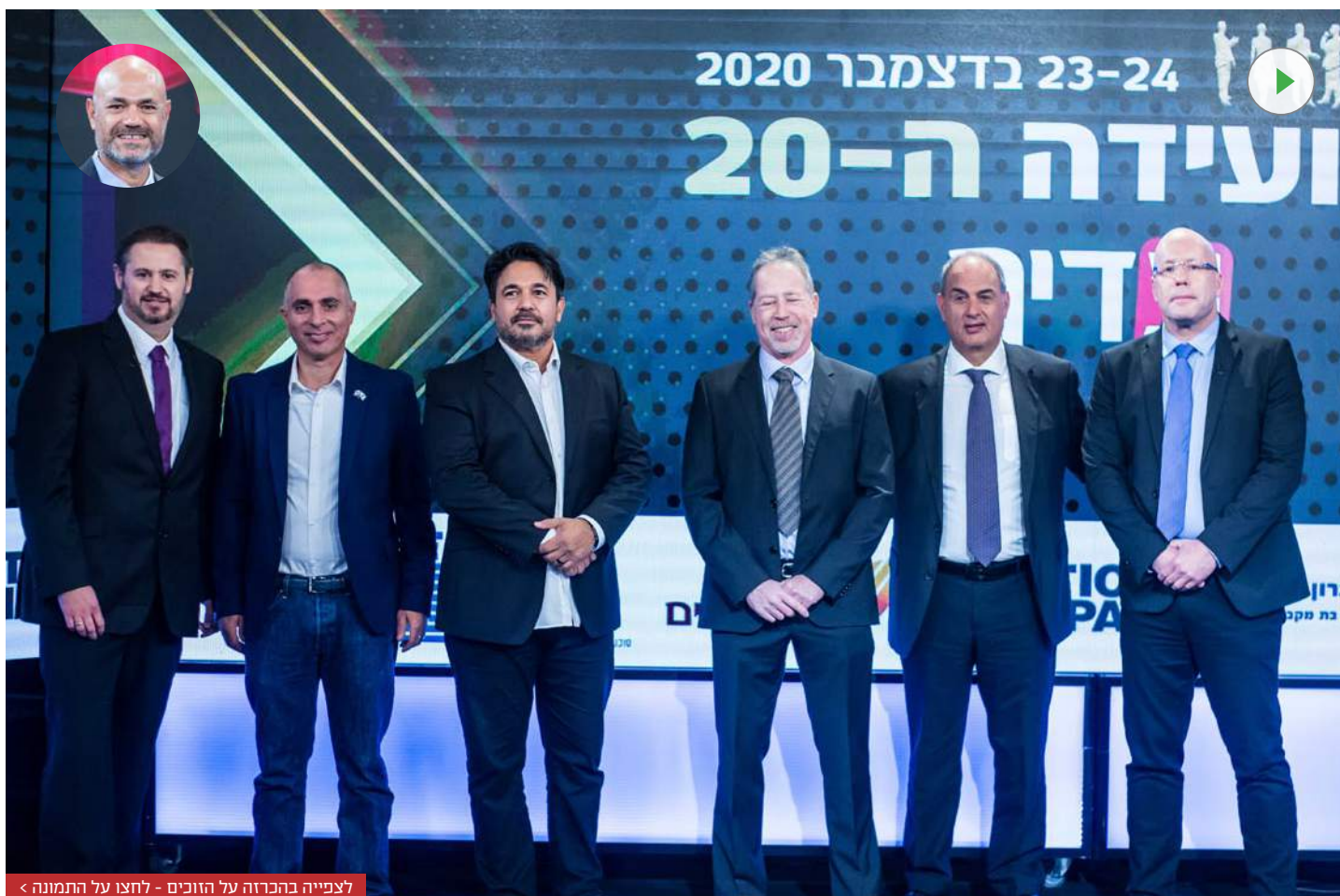
לצפייה בהכרזה על הזוכים - לחצו על התמונה <