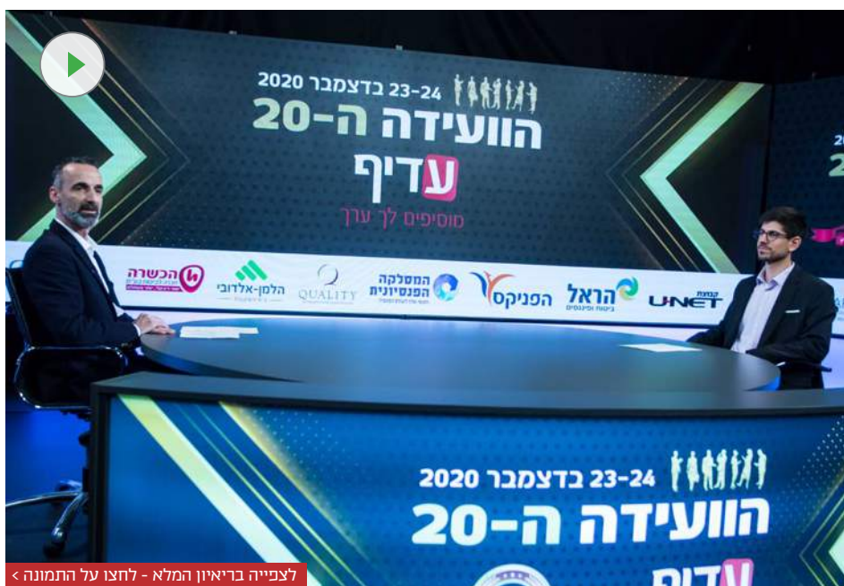
לצפייה בריאיון המלא - לחצו על התמונה <

מושקטל: "אנחנו בשחם מתלבטים בשאלה הזו כל הזמן. הייחוד שלנו זה שיש לנו את כל העולם הדיגיטלי, הוא פה והוא עוזר לנו, הוא מקל על הלקוח ועל כסוכן אבל בסוף אני צריך לגעת בך. אם אני לא נוגע בך ויודע מה חשוב לך ומה קורה עם אשתך והילד, אז אני עוד מישוה שיוודע לשווק לך מוצר מה או אחר. כל עולם הדיגיטל הוא כלי עזר שיעזור לנו לשמור על קשר אבל תזכור שבסוף כשתצטרך אותי אני אענה לך לטלפון, אני חייב לגעת ולהכיר אותך. אחרת זה לא שחם. מסע הלקוח שלנו מתחיל במפגש הראשון, העולם שלנו עוסף את כל כולך - הוא מתחיל כשאתה מצטרף לשוק העבודה, מלווה אותך כשאתה מחליף את מקום העבודה ומתחתן, אבל המסע לא מוגדר במערכת דיגיטלית אלא על ידי תכנון ומחשבה שלי, אני רוצה שתישאר בשחם 20, 30 שנה ותחווה את חוויית מתמשכת של יצירת ערך. אני רוצה שתנתק את הטלפון ותגיד מישוה חושב עלי שם".