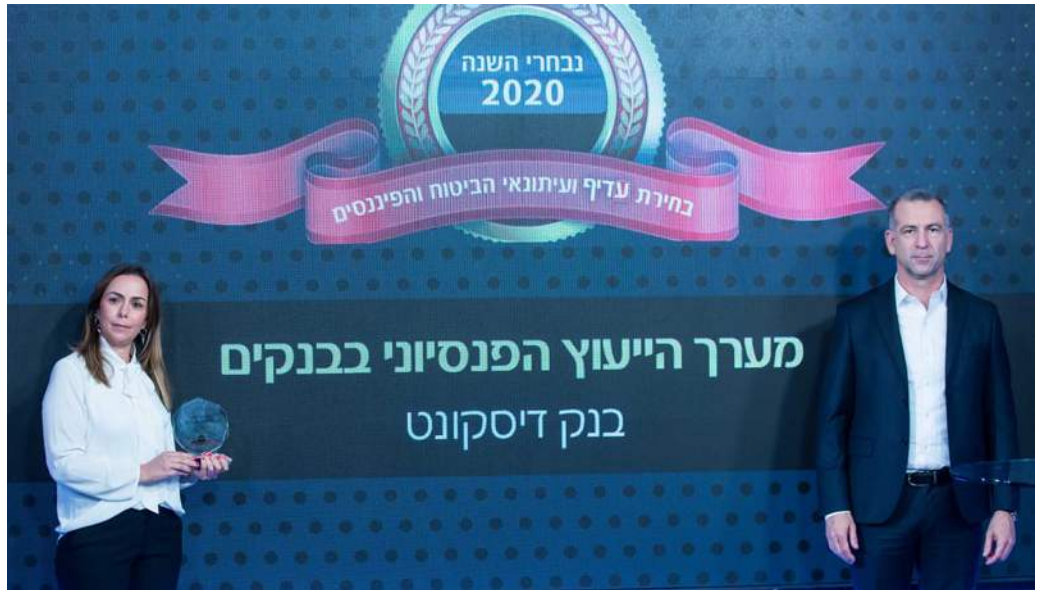
יוחאי יגור, מנהל המחלקה המקצועית - ייעוץ פנסיוני ומירי אמר, מנהלת יחידת ייעוץ פנסיוני בבנק דיסקונט

מערכי הייעוץ הפנסיוני בבנקים חוו לא מעט טלטלות בשנים האחרונות והשנה קיבלו בשורה, והם יוכלו לייצע ללקוחות גם בטלפון ובאמצעים דיגיטליים, לפחות עד תום משבר הקורונה. בינתיים, הבנק שבלט בייעוץ השנה הוא דיסקונט, שהיה הבנק שביצע את מספר השיחות הגבוה ביותר, שמר על מספר הסניפים המייעצים הגדול ביותר וגם הציג את יתרות הנועצות הגבוהות ביותר ולא פחות חשוב הצומחות ביותר.