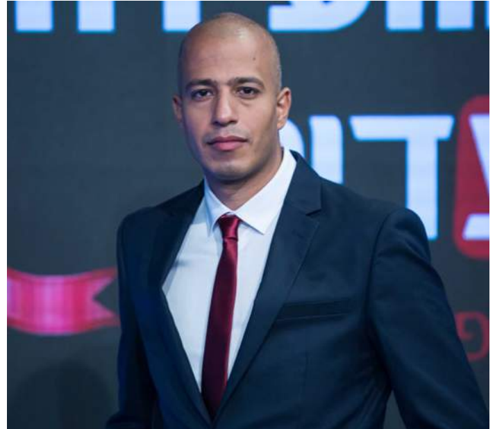
לדברי הפתיחה של הוועידה - לחצו על התמונה <