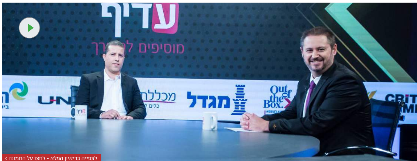
לצפייה בריאיון המלא - לחצו על התמונה <

הסגן הבכיר לממונה, האחראי על תחומי הביטוח הכללי, סוכנים ומטה, ציין כי כדי לא לפגוע בסוכנים הקיימים תינתן תקופת מעבר, הקולות או פטורים | על הסוכן האובייקטיבי: העמלה תיגזר מהפרמיה הכוללת ברוטו ולא מכל פר