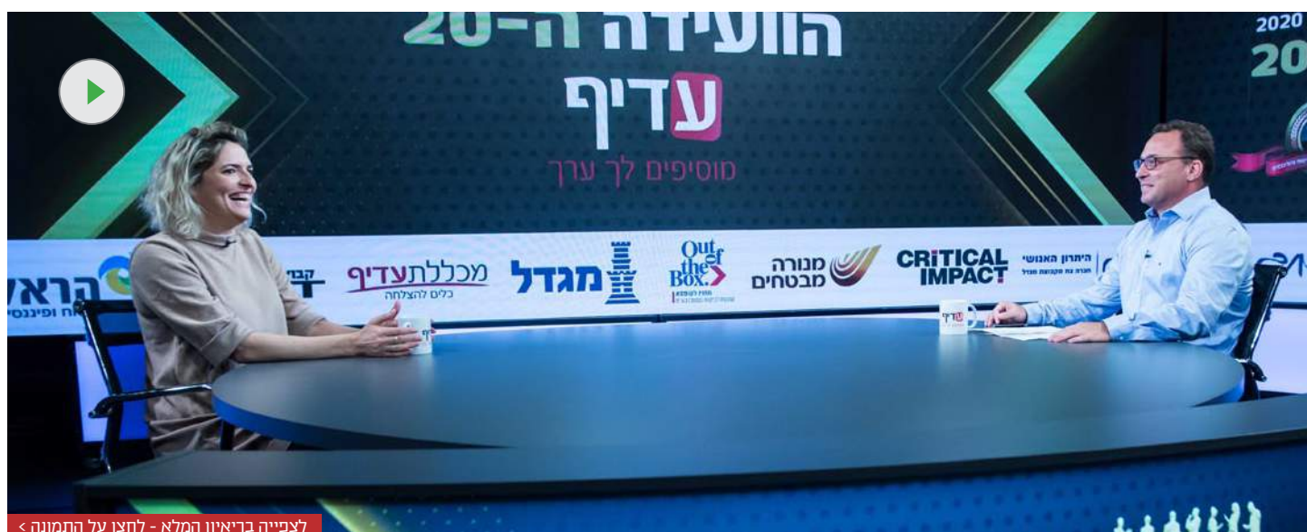
לצפייה בריאיון המלא - לחצו על התמונה >

לסמנכ"לית ומנהלת השקעות ראשית בפסגות גמל ופנסיה, יחס אמביוולנטי לביצועי בית ההשקעות ב-2020: "לא, כי כשמסתכלים על הטבלה, התוצאות לא מספיק טובות. אבל בהחלט כן, כי אפשר לראות שבמחצית השנייה הגרפים מאוד חיוביים