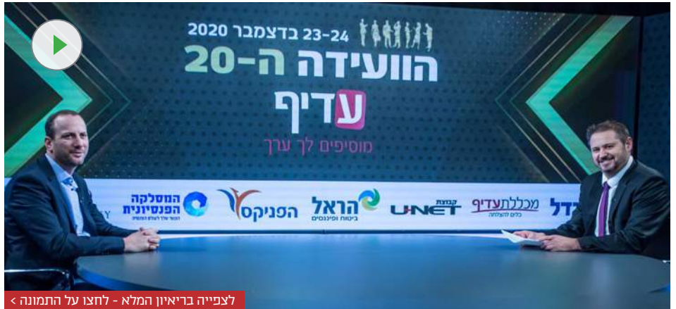
לצפייה בריאיון המלא - לחצו על התמונה >

"בפן העסקי יש הרבה הישגים שאפשר להתגאות בהם. אנחנו מסכמים שנה פנטסטית בכל קו המוצרים והפעילויות של בית ההשקעות. אם אני צריך להצביע על משהו קטן בצד העסקי זה הצמיחה בקרן הפנסייה ששנה נוספת הכפילה את עצמה, לפני כמה ימים פורסמו הנתונים ואני רואה שגם באוקטובר ובנובמבר אנחנו נמצאים במקום הראשון מעבר לכל קרנות הפנסייה של חברות הביטוח, ואני מקווה שבשנת 2020 אולי התחלנו לעורר את העם. הציבור להתחיל להשקיע בקרן הפנסייה שלהם".