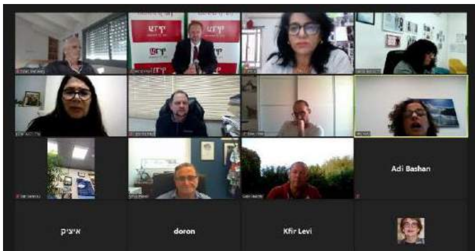
מפגש חברי הוועדה המקצועית לדירוג נבחרי השנה בתחום הבריאות