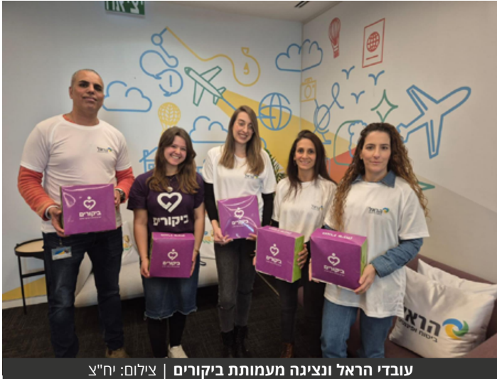
עובדי הראל ונציגה מעמותת ביקורים

עובדי קבוצת הראל ביטוח ופיננסים קיימו פעילות התנדבות, שנערכה בשיתוף עמותת ביקורים, שנועדה לחזק ולהרחיב את הקשר של עובדי הראל עם הקהילה בתקופה זו.