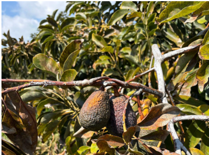
נזקי הקרה לאבוקדו בקיבוץ אלונים

מאות אלפי דונמים של גידולים נפגעו בגל הקור שהביאה עמה הסופה "קורל"