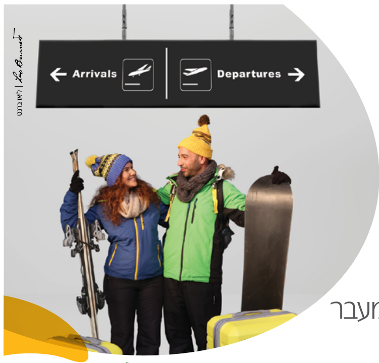
Le Bonnet | לואי בונט