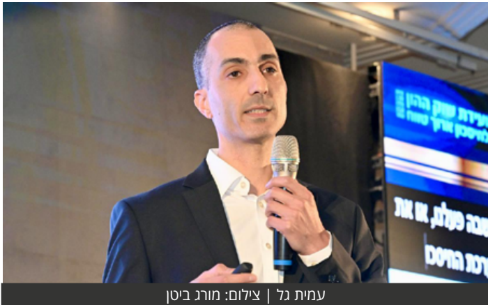
עמית גל

הממונה על שוק ההון הצהיר בוועידת שוק ההון לחיסכון ארוך טווח, על הגברת הפיקוח על עמלות מופרזות ופעילות ללא רישיון, הדגיש את הישגי רפורמת בכר לצד האתגרים שבמערכת הדיגיטלית, והבהיר - לבעלי השליטה יש אחריות מוגברת על ניהול סיכונים