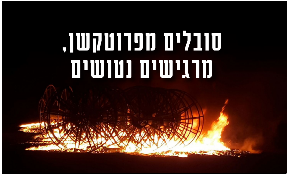
השחתת רכוש חקלאי