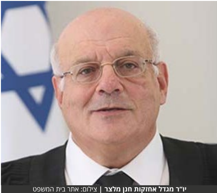
יו"ר מגדל אחזקות חנן מלצר

מדובר על הוראה להפריד בין מקום מושבו של יו"ר מגדל אחזקות חנן מלצר, לבין בעלי תפקידים בחברה בת מגדל ביטוח