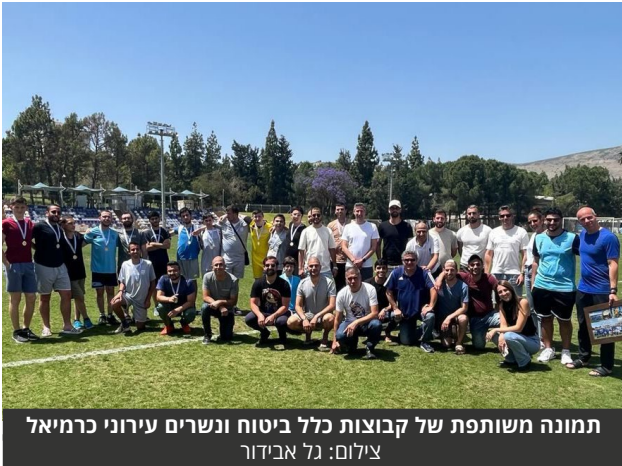
תמונה משותפת של קבוצת כלל ביטוח ונשרים עירוני כרמיאל

עוד נמסר כי לצד שיתוף פעולה זה, כלל ביטוח ופיננסים פתחה השנה עבור עובדי החברה שהם הורים לילדים עם צרכים מיוחדים, קהילת הורים מיוחדת לשיתוף, ייעוץ, התמודדות ויצירת תמהיל פעילויות מותאם.