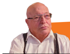
חוות דעת יעקב קיהל

3. פערי תמחיר שהוצעו בין המבטחים (כמו לתקופת גילוי נוספת או לגבול אחריות גבוה יותר מזה שהוצע) ניתנים להשוואה בהליך משו ומתן משלים במסגרת נוהלי הרשות.