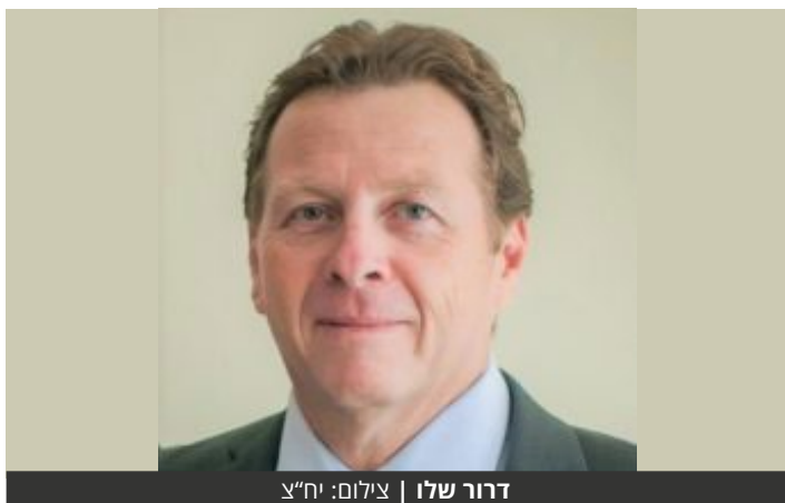
דרור שלו

שלו מחליף את נדב גרינשפן שהתפטר לאחרונה מסיבות אישיות לאחר כ-8.5 חודשים בתפקיד | בתפקידו האחרון היה שלו מנהל אגף ביטחון וחירום בעיריית חולון | על מינויו הצפוי של שלו פורסם בלעדית בעדיף