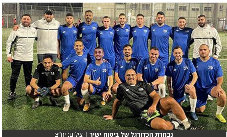
נבחרת הכדורגל של ביטוח ישיר