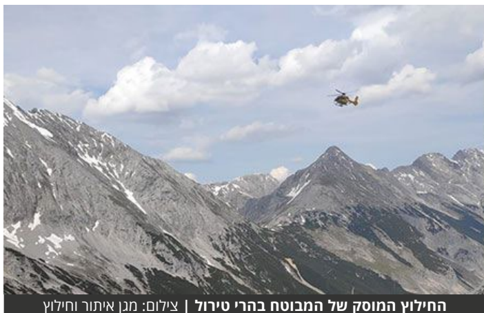
החילוץ המוסק של המבוטח בהרי טירול

המטייל נפל ושבר את רגלו | האירוע דווח באמצעות טלפון לווייני למוקד החירום של מגן איתור וחילוץ, חברת החילוץ של כלל ביטוח