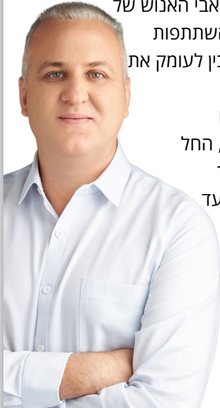
עומר בן יאיר

עד כה השלימו כ-600 מעסיקים הכשרה מקיפה בנושא שהעניק בית ההשקעות