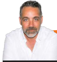
מגדילים ערך ורווחיות ארז שלו, מנטור עסקי

מדוע אתם ממהרים להימנע מעימות עם לקוח מסרב? תעלו להתקפה וסייעו ללקוח לקבל החלטות מיטיבות