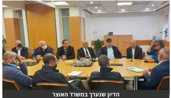
הדיון שנערך במשרד האוצר

Psyber - המאפשרת לחברות ביטוח להעריך ולנטר סיכונים סייבר פנים ארגוניים ובכך לדייק את עלויות פרמיות הביטוח. נמסר כי ההשקעה של איילון במיזם הייעודי לפיתוח מיזמים בתחומים משיקים לענף הביטוח מוערכת בכ-10 מיליון שקלים וסכומי ההשקעה הראשונית בסטרטאפים שהתקבלו לתכנית נעים בין 150,000 שקלים ל-500,000 שקלים.