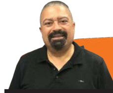
ביטוח חבויות יגאל סרי

לדוגמה, חברת אבטחה החלה את דרכה במאבטחת מפעלים וכך נעשתה הפוליסה הראשונית. כל מה שרצה המבוטח היה לקבל אישור ביטוח בעבור משרד המשפטים. לאחר כשנה, בעת חידוש הביטוח, דאג הסוכן לבחון האם יש שינויים בתחומי עיסוק החברה. בחינתו גילתה כי החברה החלה להתקין מוצרי מיגון והתרעה וכן מבצעת אבטחה באתרי בניה ובמועדונים. עסקיה, אפוא, התרחבו. ללא התאמה נכונה זו של הסוכן, היה מוצא עצמו המבוטח בביטוח ללא כיסוי מספק ונכון. דוגמה נוספת: גנן שהתחיל "בקטן", בגינות פרטיות וכד', הגדיל את מרחב עיסוקו והחל לעבוד מול רשויות מקומיות ומועצות בתחום גיזום עצים והדברה. כשנדרש להחתים את חברת הביטוח על אישור הביטוח, הבחין סוכן הביטוח בכך שהפוליסה הקיימת אינה מתאימה עוד ויש ליצור התאמה בפוליסה על מנת שתיתן מענה לשינוי שחל בעסק ולהוספת תחומים נוספים בעיסוקו של המבוטח.