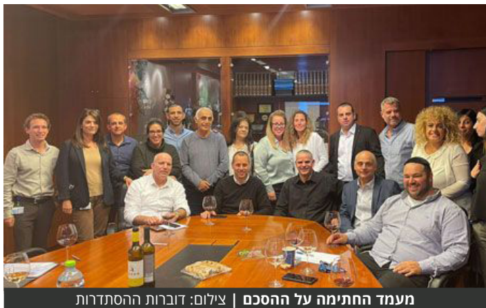
מעמד החתימה על ההסכם

אומדן העלות השנתית הממוצעת של הוצאות כוח אדם בשנות ההסכם של הפניקס הוא כ-23.6 מיליון שקלים