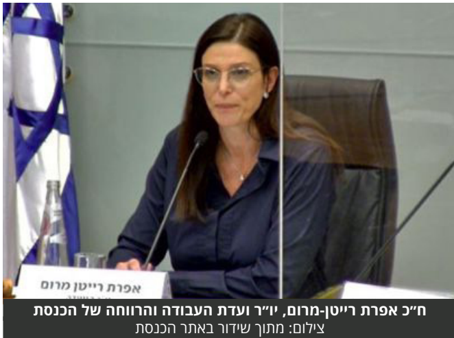
ח"כ אפרת רייטן-מרום, יו"ר ועדת העבודה והרווחה של הכנסת

בדיון שקיימה ועדת העבודה והרווחה של הכנסת פירט נציג של משרד הכלכלה על הכשרות מקצועיות מותאמות, בשיתוף מעסיקים, לנשים בגילאי 50-60