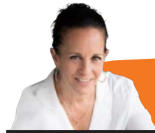
עוצרים לשם שינוי טל דן

נשאלתי פעם שאלה מכשילה בראיון עבודה (פעם, עוד בתקופה שכל נושא המגדר לא היה ISSUE ולכן אשאיר אותה כמות שהיתה, במקור) ...השאלה הזו לא עזבה אותי מאז: