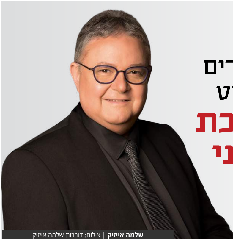
שלמה אייזיק