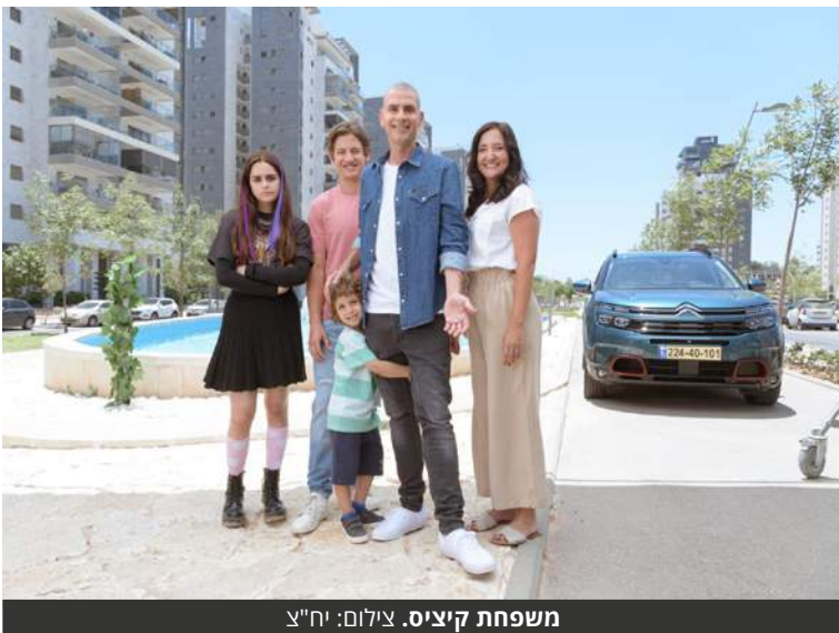
משפחת קיזיס.