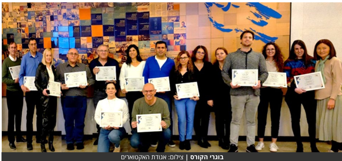
בוגרי הקורס

אגודת האקטוארים ציינה את סיום המחזור הראשון של הקורס המתקדם "איזון משאבים" | הסדר איזון משאבים עוסק בעריכת רכוש שווה של הרכוש המוגדר כמשותף לבני זוג בעת סיום הנישואין או פרידה של בני זוג