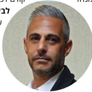
שקד צור

הגבוהות שהוא מביא לתפקיד יאפשרו לו לבצע את תפקידו על הצד הטוב ביותר".