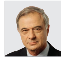
לין. "תומך בזכות העובד לבחור"