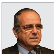
ברוש. "כל אדם צריך להפריש כמה עשרות שקלים בחודש כדי לחסוך לגיל הפנסיה"