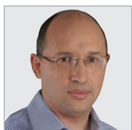
ניסנקורן: "רואים ביחד את טובת המשק"

חלק גדול משכבת העניים. לא יכול להיות שאדם יעבוד כל חייו וכאשר יגיע לגיל זקנה הוא פתאום הופך להיות עני. אני מאוד שמח שאחרי שנים ארוכות של דיונים הנושא נפתר ואני מקווה מאוד שהוא יצא לדרך."