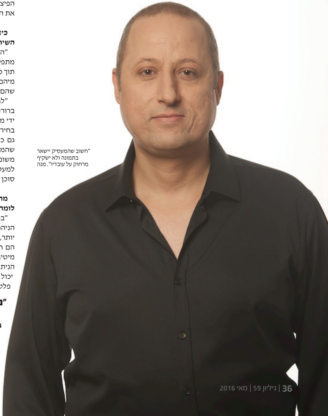
"חשוב שהמעסיק יישאר בתמונה ולא ישקיף מרחוק על עובדיו". מנה

"למעסיק העובד עם מנהל הסדר ראוי, אני ממליץ להיעזר בו במרבית המשימות אם לא בכלן. מנהל ההסדר