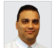
סולומון. "התערבות יתר של המדינה"