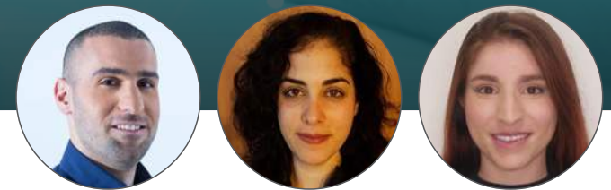
מאת שיר הרפז, נטע קלמפרט, נדב פסנדי ועיב אביטל

שימוש בטכנולוגיות חדשניות מאפשר לחברות הביטוח וכאלה שאינן מתחום הביטוח, להציע ללקוחותיהן מוצרי ביטוח מותאמים אישית במעמד הרכישה • טסלה, WeWork, וולמארט ואמזון הן רשימה חלקית של החברות שנכנסו לתחום